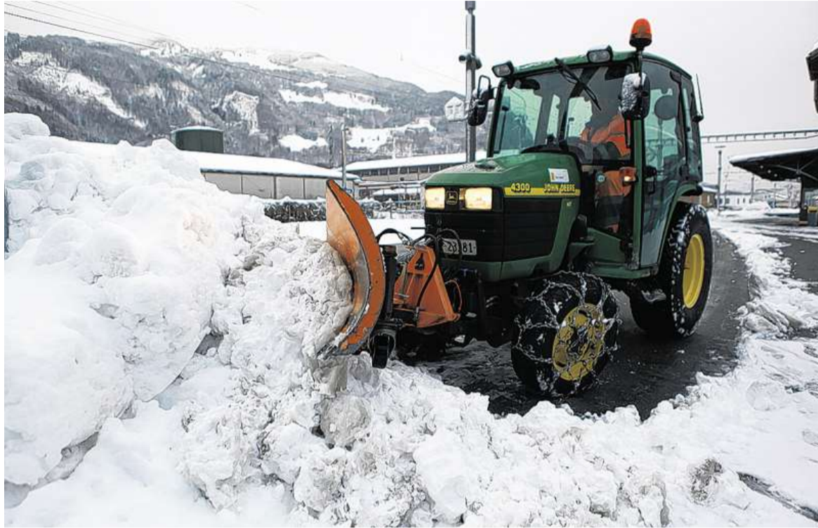
Er muss weg: Dieser Schneepflug kämpft gegen die weisse Pracht am Bahnhof Näfels.

Durch den vielen Neuschnee ist die Lawinengefahr im Kanton Glarus gestiegen. Der Skilift Schilt muss deshalb wohl sogar später öffnen. Auf den Strassen blieb die Lage ruhig.