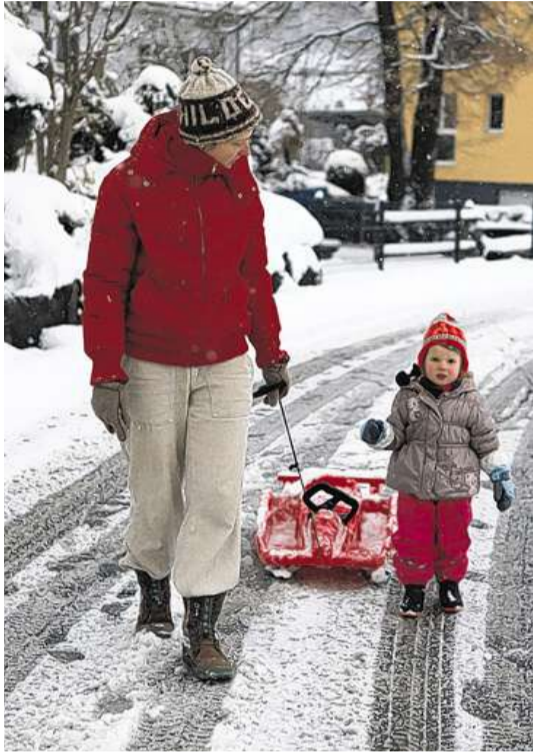
Endlich Schnee: Nun fängt das Schlitteln an.